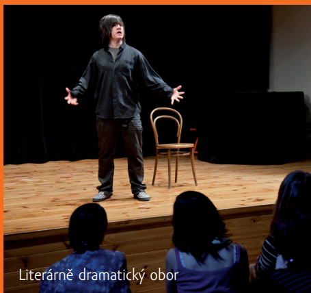
Literárně dramatický obor

Prostějov. V těchto soutěžích ZUŠ bývají naši žáci v rámci kraje jedni z nejúspěšnějších. Nejnadanější z nich připravujeme na přijímací zkoušky na umělecké školy - konzervatoře, DAMU. V současné době tři naši žáci studují dramatický obor na Konzervatoři v Praze.